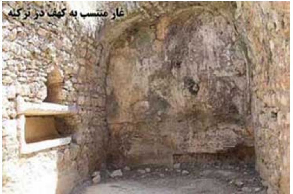
غار منتسب به کهنه در ترکیه